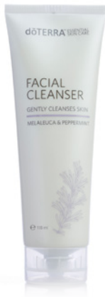
FACIAL CLEANSER 118 ml

Jedes Produkt der ätherischen dōTERRA Hautpflegeserie enthält die natürliche Kraft der ätherischer Öle, modernste Pflanzentechnologie sowie natürliche Pflanzenextrakte. So bleibt Ihre Haut sichtbar jünger, gesünder und geschmeidig! Bekämpfen Sie die sichtbaren Zeichen des Alterns gezielt mit der ätherischen dōTERRA Hautpflege.