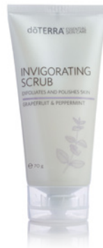
INVIGORATING SCRUB 70 g

Der dōTERRA Gesichtereiniger enthält die CPTG™ ätherischen Öle Teebaum und Pfefferminze, die dafür bekannt sind, die Haut zu reinigen, zu festigen und ein gesundes Aussehen zu unterstützen. Die natürlichen Reinigungskräfte des Yuccawurzel- und Seifenrindenextrakts entfernen sanft den Schmutz und sorgen für ein sauberes, frisches und glattes Hautbild.