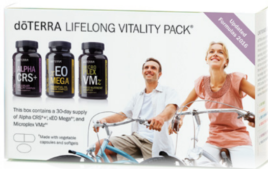
dōTERRA LIFELONG VITALITY PACK™ NAHRUNGSERGÄNZUNG MIT ALPHA CRS™+, MICROPLEX VMZ™ UND xEO MEGA™