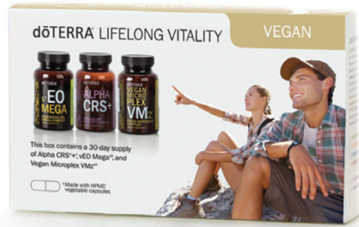
dōTERRA LIFELONG VITALITY VEGAN PACK™ NAHRUNGSERGÄNZUNG MIT ALPHA CRS™+, MICROPLEX VMZ™ UND vEO MEGA™